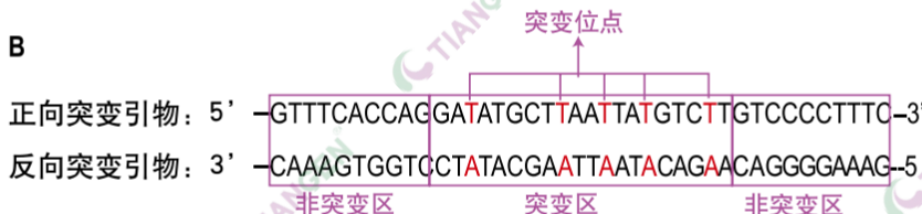
图2 TIANGEN 快速定点突变试剂盒引物设计原则